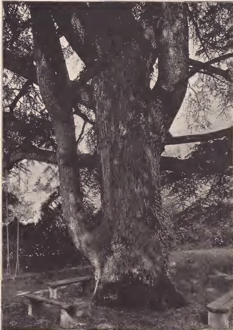
Stamm und inneres Astwerk der Zeder von Mont Riond le Crêt